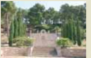
Monument Mestre Güell