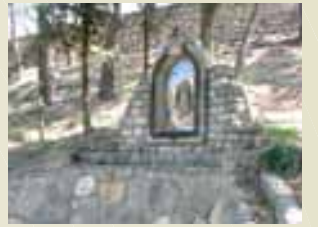
Font de St. Magí