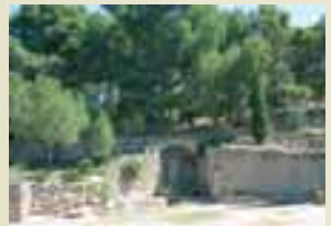
Font del Congrés