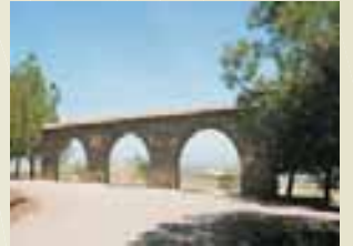
Arcades d'Ossó de Sió