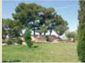
Font dels Vents