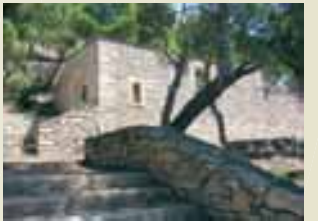
Restes de l'hort de Sanrama