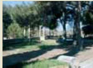
Pèrgola dels Viatjants