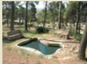
Font de la Guitarra