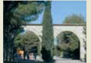
Arcades dels targarins fora vila