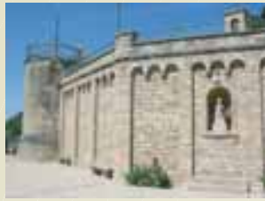
Plaça de la M. de Déu de Montserrat