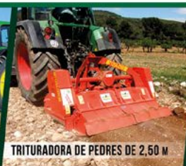
TRITURADORA DE PEDRES DE 2,50 M

No compri avui el que potser no li serveix demà