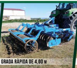
GRADA RÀPIDA DE 4,00 M