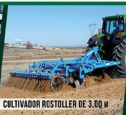
CULTIVADOR ROSTOLLER DE 3,00 M