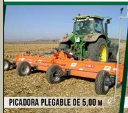
PICADORA PLEGABLE DE 5,00 M