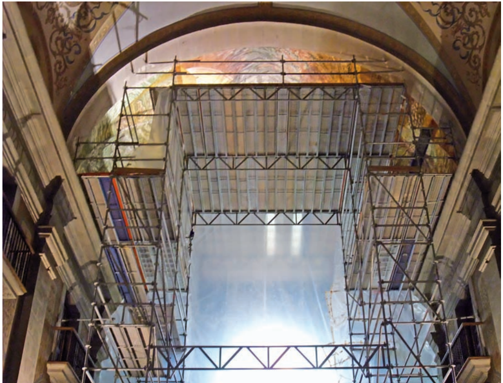
Bastida de les voltes de la nau de Santa Maria de l'Alba. Tàrrega, 2009.

superfícies murals, adaptar-los al pla pictòric i superar les distorsions òptiques aplicant la tàctica adequada.