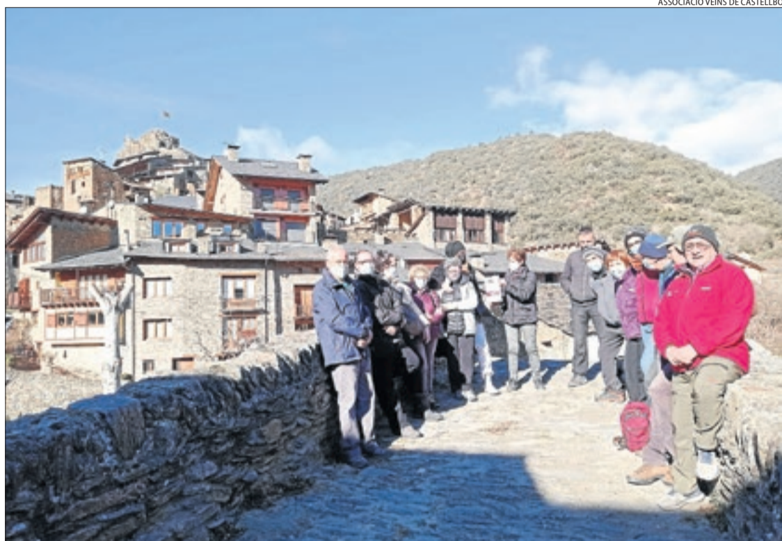
Foto dels participants en el joc de pistes, al pont de Castellbò.

Un joier suís establert al nucli de Turbiàs organitza un joc de pistes per trobar els anells de Melcior, Gaspar i Baltasar || L'objectiu és dinamitzar la vall, en la qual viuen 200 persones