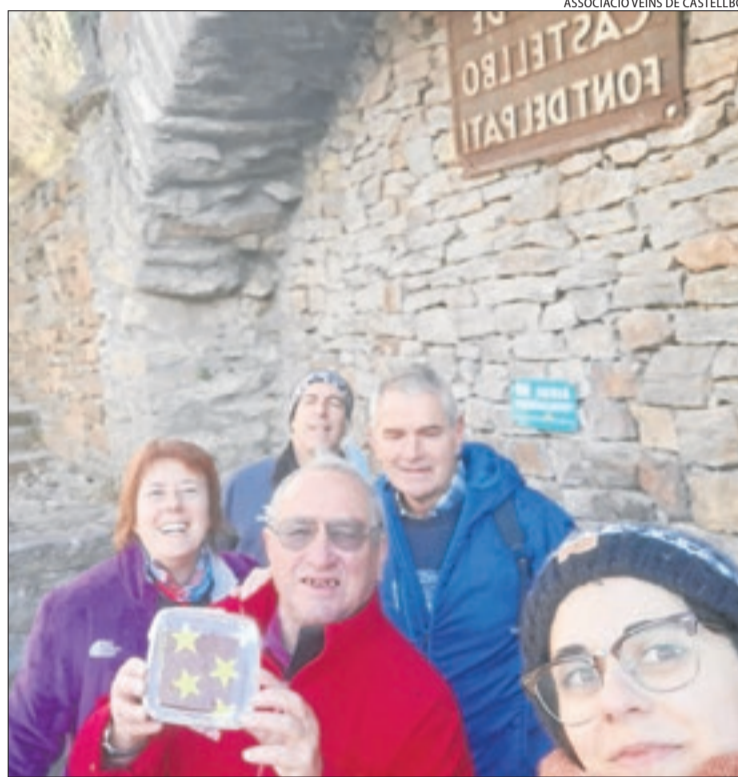
El grup de veïns que va localitzar els anells.