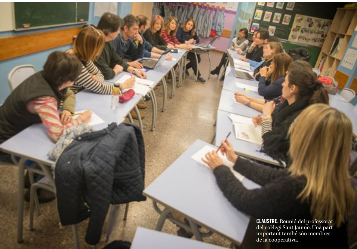
CLAUSTRE. Reunió del professorat del col·legi Sant Jaume. Una part important també són membres de la cooperativa.