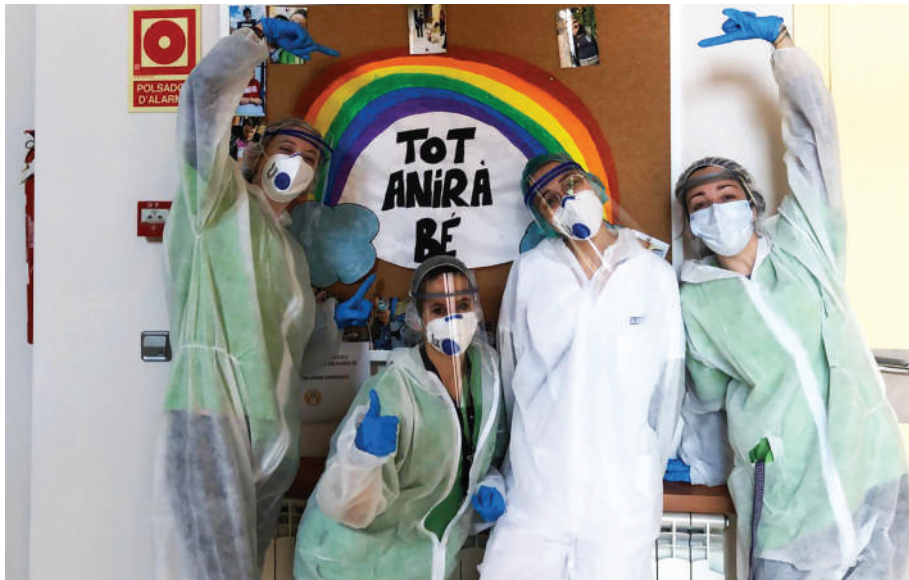
Personal de Talma amb les proteccions facials donades per l'Ateneu.

Ara, les peces que vagin sorgint es volen repartir a farmàcies i comerços de les Garrigues i ja en tenen de demanades a residències del Segrià i el Pla d'Urgell i centres de discapacitats de la província. Quan acabi la necessitat, la intenció és donar una impressora a Talma i una a l'INS Josep Vallverdú de les Borges. Amb