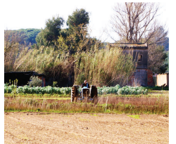
Els terminis variaran segons la situació

posterior a la suspensió de l'estat d'alarma. El Departament d'Agricultura recorda que el seu web www.agricultura.gencat.cat , a través de la pàgina específica dedicada a la declaració, disposa de tota la informació per fer la sol·licitud dels ajuts, i així s'hi pot trobar l'accés a l'aplicació DUN, els manuals, les entitats col·laboradores i els contactes dels grups de suport.