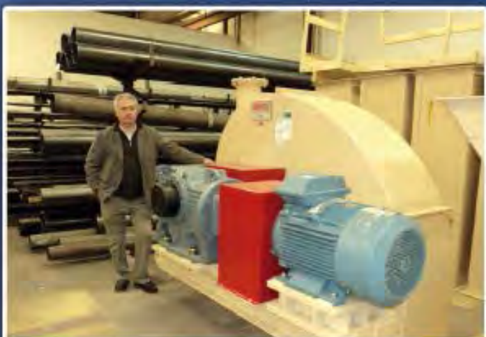
TÊTE ÉLÉVATEUR TRANSMISSION FLOTTANT