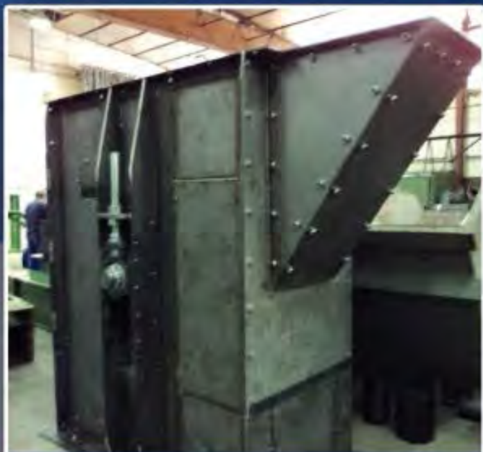
FABRICATION PIED ÉLÉVATEUR