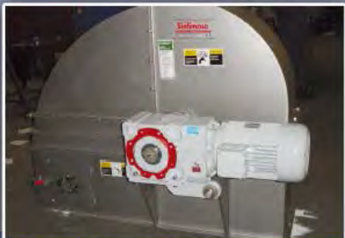
TÊTE ÉLÉVATEUR POUR ENGRAIS