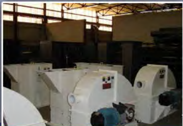
CONJOINT TÊTES AU PIEDS ÉLÉVATEURS