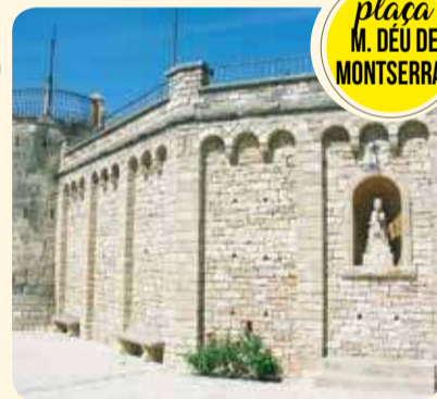
plaça M. DEU DE MONTSERRAT