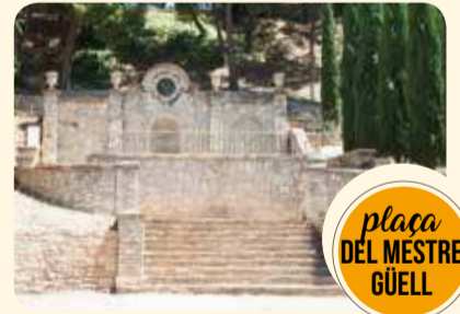
plaça DEL MESTRE GÜELL

Conjunt d'una premsa d'oli i les seves piques de pedra provinents del nucli de Conill. L'any 1980 va ser donat a la ciutat pels seus propietaris, la família Vall-Palou, i se'n va fer el muntatge al parc l'any 1982. L'any 2004 va ser dotat tot el conjunt d'una coberta adequada per a la seva protecció.