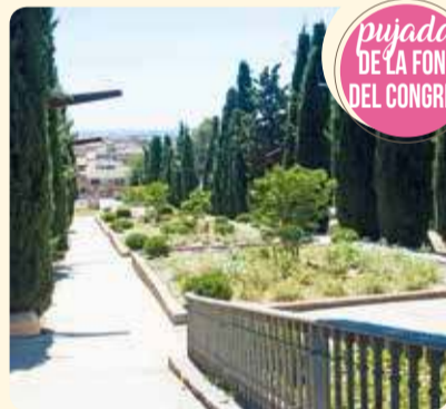
pujada de la font del Congrés

Entrada principal al parc des del carrer del Segle XX. Va ser totalment remodelada l'any 2010 per commemorar el centenari de la font del Congrés. La portalada d'accés i tot l'enllumenat es deu a la forja de l'artista Josep Castellana i Niubó.