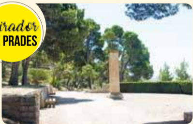
mirador DE PRADES

L'any 1955 es va construir un mur de contenció entre les torrasses del nord i la de l'est, situant-hi al bell mig una capelleta amb la imatge de la Mare de Déu de Montserrat, realitzada per l'escultor Jaume Fontbernat. L'any 2000 es va fer una ampliació de la plaça i s'hi van instal·lar dues arcades provinents de l'antiga caserna militar que estava situada a la plaça del Pati de la Ciutat.