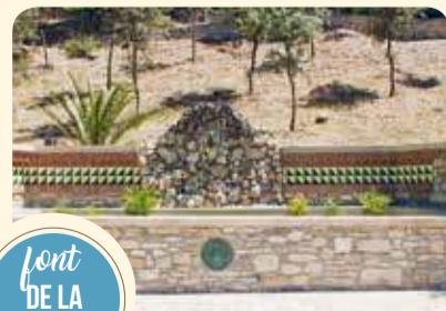
font DE LA GRANOTA

Tot el conjunt monumental dedicat al Mestre Güell es va bastir l'any 1952 a la seva memòria. Va ser inaugurat el 16 de novembre d'aquell any, quan havien transcorregut 22 anys del seu decés. L'any 1999 es va dotar tot el terra de la plaça d'un enllosat de pedra i d'un petit sortidor d'aigua.