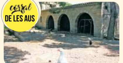
corral DE LES AUS

Un antic dipòsit de reg bastit l'any 1919 va ser posteriorment convertit en la font de la Granota. L'any 2015 es va remodelar totalment.