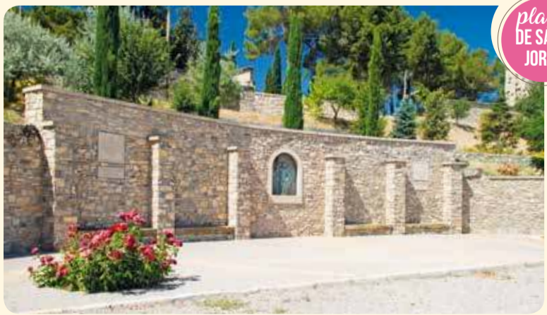
plaça DE SANT JORDI

Finestral del segle XIV procedent de la capella de la Sagrada Família, annexa al palau dels Marquesos de la Floresta, situada a l'antic carrer anomenat de Cervera. El seu muntatge al parc es va fer l'any 1982.