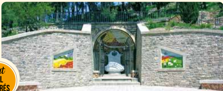
font DEL CONGRÉS

Situat a la part de solana del parc. Des d'allí es poden veure les muntanyes de Prades. Es va fer la remodelació actual a la dècada dels anys noranta del segle passat, i posteriorment s'hi va situar una columna de pedra procedent del corral del bestiar de cal Gomà.