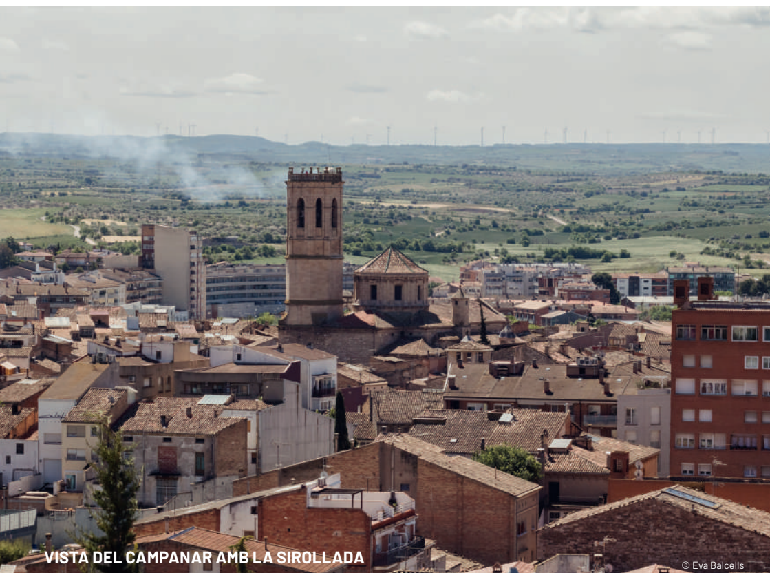
VISTA DEL CAMPANAR AMB LA SIROLLADA

Altres passis i dies: divendres 12 de maig a 2/4 de 12 del migdia, 2/4 de 2 i a les 5 de la tarda i 2/4 de 8 del vespre; dissabte 13 de maig a les 11 del matí, 2/4 de dues, 2/4 de 5 i a les 6 de la tarda; diumenge 14 de maig a les 11 del matí, 2/4 de 2 i 5 de la tarda i a les 8 del vespre