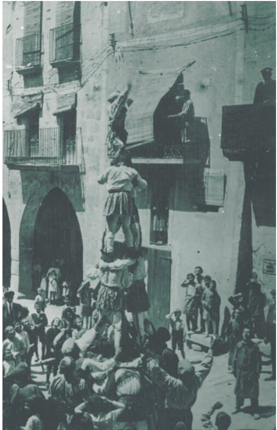
El Ball de Valencians d'Arbeca en els anys 1925 o 1926.

Gràcies a l'esforç i la passió de l'Esbart Albada, en aquesta Festa Major 2024, els targarins podrem gaudir d'una reintroducció del Ball dels Valencians que ve apadrinada pel Ball de Valencians de l'Esbart Arrels de Lleida.