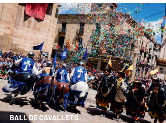
BALL DE CAVALLETS

Reserves Picampanar a picampanar2023@gmail.com o al telèfon 630 744 566.