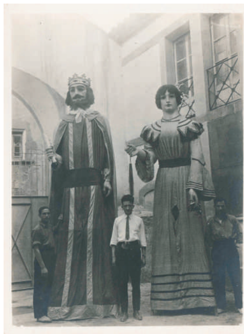
Gegants de la Mercè. 23/09/1927.

En aquesta Festa Major, els nostres gegants lluiran millor que mai!