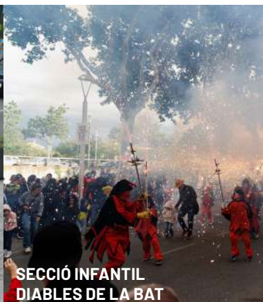
SECCIÓ INFANTIL DIABLES DE LA BAT