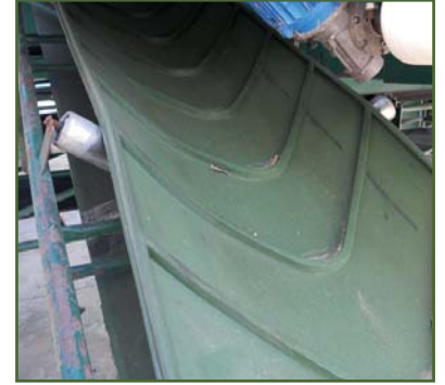
Bordes laterales de contención.